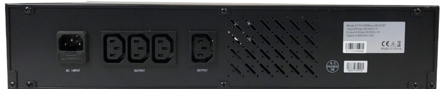
POWERbox 850VA 19"